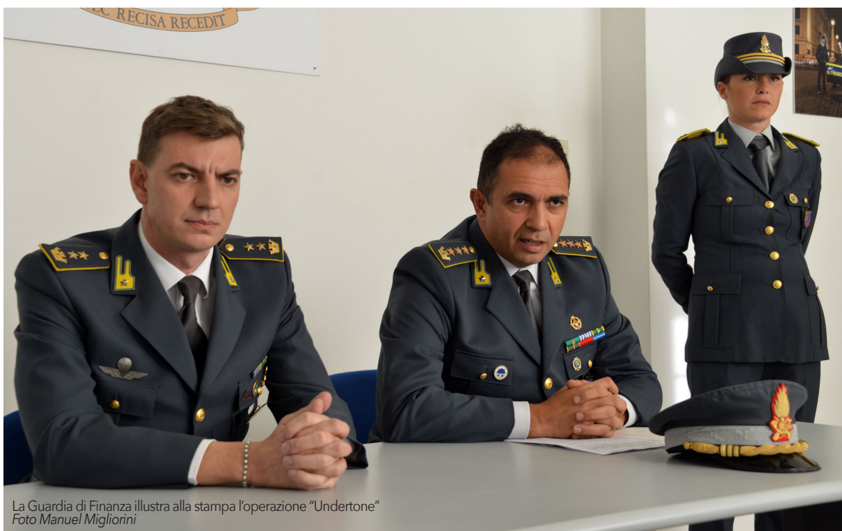
La Guardia di Finanza illustra alla stampa l'operazione "Undertone"